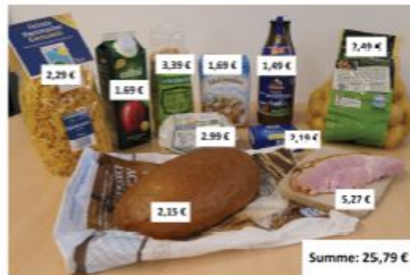
Einkauf im Supermarkt mit Preisen.