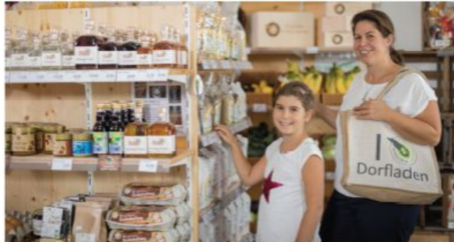
Vor dem regionalen Einkaufsregal im Dorfladen.

Gewinner im doppelten Sinn: • fast alle Produkte konnten regional gekauft werden • Einkauf war um 2,40 Euro günstiger